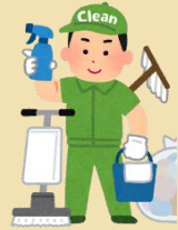
ビルクリーニング