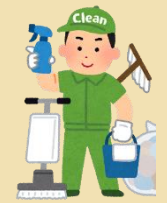
ビルクリーニング